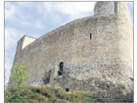
El Castell de Mur, al Pallars Jussà.

■ Batalla monumental va iniciar ahir a TV3 la segona temporada i val a recordar que, a la primera, la Seu Vella va ser la guanyadora. Tanmateix, el ¿concurs? que presenta Roger de Gràcia naix llastat des del seu mateix plantejament (una cosa que també li passa al Joc de cartes de Marc Ribas). Cada monument del territori català té el seu atractiu, el seu reclam turístic, el seu bagatge cultural i la seua història.