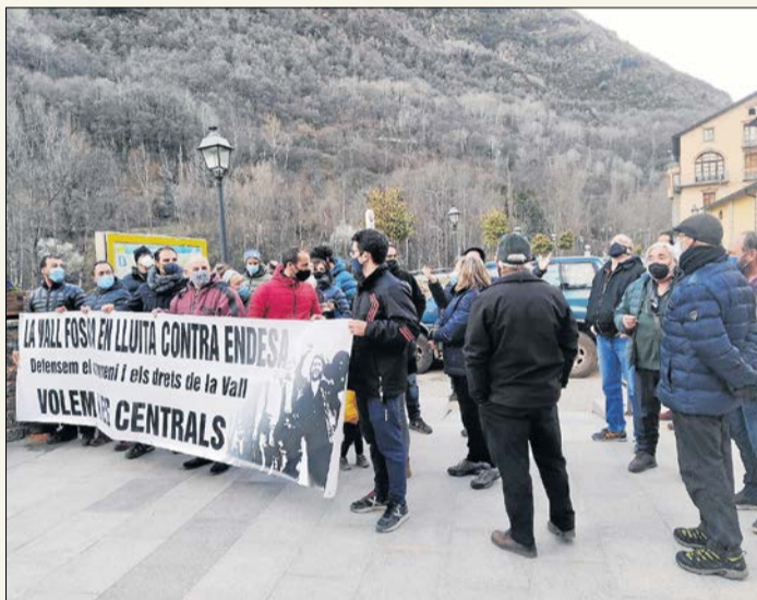
Manifestació contra els talls de llum l'any passat.

que s'ha de basar en la fixada per contracte el 1927, de 0,0021 €/kWh. La magistrada del jutjat de Tremp ha avalat aquest últim criteri.