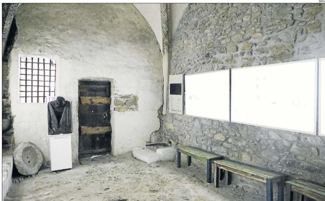
Interior de la presó de Sort, actualment convertida en un petit museu.

LELEIDA | El Memorial Democràtic ha fet pública recentment la llista de projectes als quals ha concedit subvencions per posar el seu gra de sorra en la divulgació i recuperació de la memòria històrica en diferents àmbits. En total, a la convocatòria de l'any passat, l'organisme ha atorgat 90.153,11 euros a cinquanta-tres projectes de tot Catalunya. Entre aquests se n'inclouen vuit de les comarques lleidatanes, amb un import total de 10.998 euros, que van des dels 2.700 fins als 330 euros. D'aquesta forma, el Memorial Democràtic ha concedit una ajuda a l'ajuntament de Sort per a millores a la Presó Museu Camí de la Llibertat, així com actualitzar la pàgina web, i també a l'ajuntament de Talarn, per al refugi antiaeri de la central hidroelèctrica.