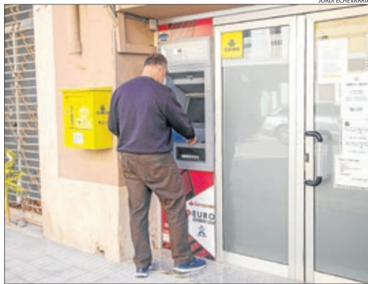
El nou caixer a l'oficina de Correus de Bellvís aquesta setmana.

De fet, a començaments de desembre del 2021, el síndic va